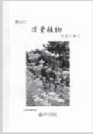
葉山に万葉植物を見て歩く 500円