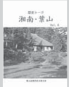
歴史トーク 湘南・葉山 Vol.1~4 各1,000円