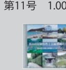
葉山町の景観特性と景観形成の方針 CD1枚 500円