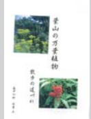
葉山の万葉植物 500円