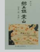
郷土誌 葉山 創刊号~第7号 各800円 第8~10号 各900円 第11号 1,000円