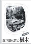
森戸川林道の樹木 500円