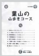
葉山の山歩きコース 500円