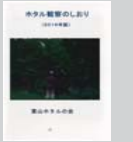
ホタル観察のしおり 100円