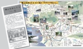
葉山を歩こう (全10種) 1部 100円 4部組 350円 6部組 500円 10部組 850円