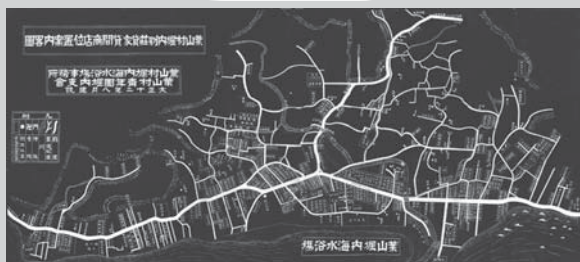
大正十二年八月の古地図 90×40 1,500円 (関東大震災の直前の堀内商店街案内図)