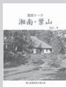
歴史トーク 湘南・葉山 Vol.1~4 各1,000円