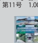
葉山町の景観特性と景観形成の方針 CD1枚 500円