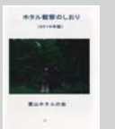
ホタル観察のしおり 100円