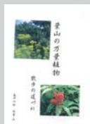
葉山の万葉植物 500円