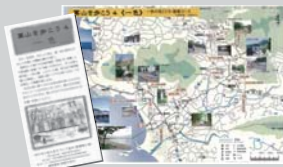
葉山を歩こう (全10種) 1部 100円 4部組 350円 6部組 500円 10部組 850円