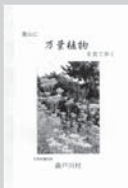
葉山に万葉植物を見て歩く 500円