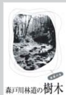
森戸川林道の樹木 500円