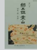
郷土誌 葉山 創刊号~第7号 各800円 第8~10号 各900円 第11号 1,000円