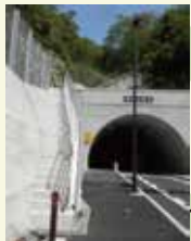
トンネル脇に古墳 に行く石段あり