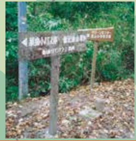
5 クリーンセンター分岐点